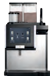
WMF 9000 F (External Storage)