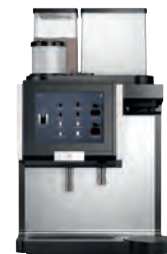
WMF 9000 F (Internal Storage)